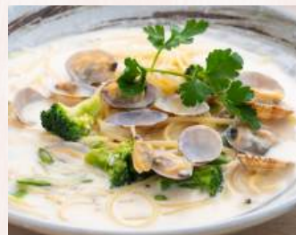
あさりたっぷりクラムチャウダー