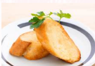
ガーリックトースト