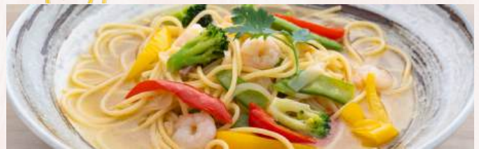
海老と旬菜スープパスタ