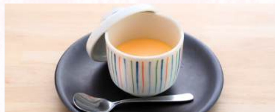
百里なめらかプリン