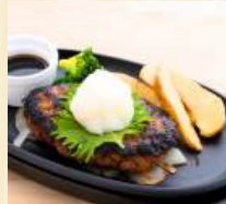
おろしポン酢ハンバーグ