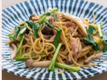
小美玉ニラと3種キノコのバター醤油