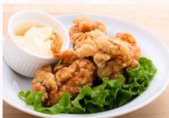
おつまみから揚げ