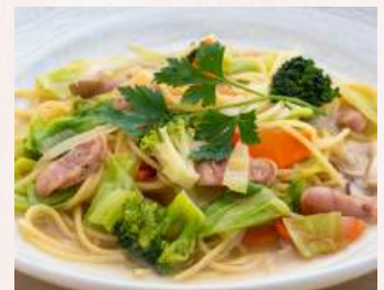
小美玉ニラとソーセージのポトフ風