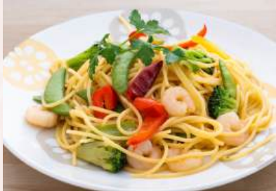
ぷりぷり海老と彩野菜ペペロンチーノ