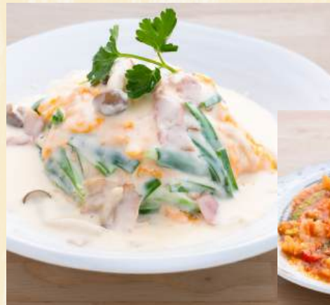
ベーコンと小美玉産ニラのオムライス