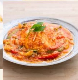
海老と季節野菜のトマトオムライス