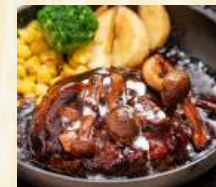
デミグラスソースのハンバーグ