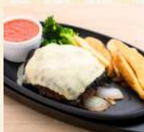
完熟トマトソースとチーズのハンバーグ