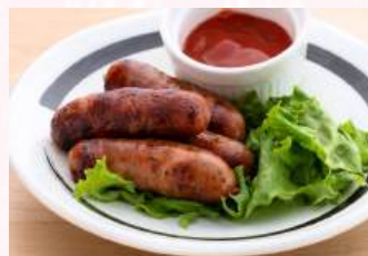
粗挽きソーセージ