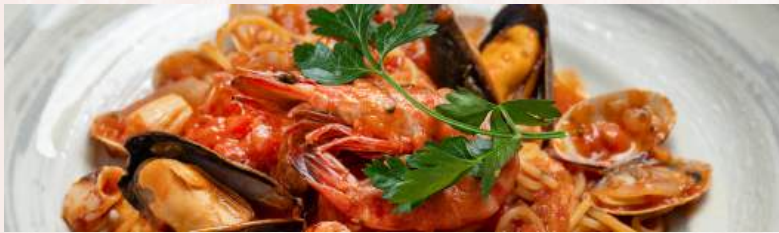
魚介たっぷりペスカトーレ